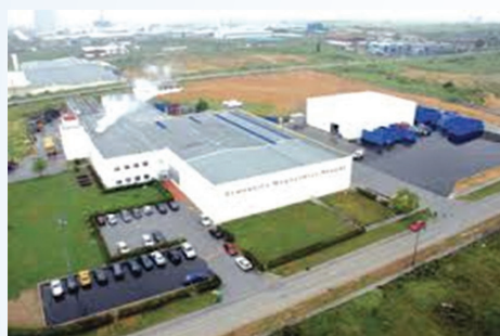
Ζυθοποιία Μακεδονίας-Θράκης Βεργίνα, Ροδόπη