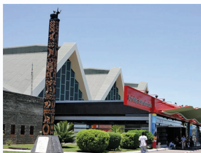
Αεροδρόμιο Ανταναναρίβο, Μαδαγασκάρη