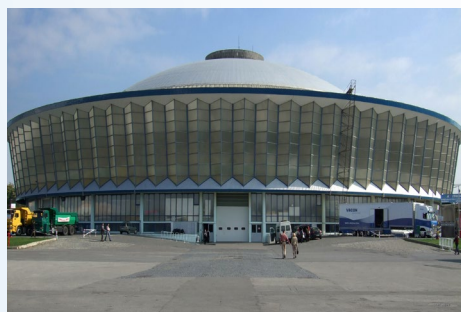
Εκθεσιακό κέντρο Romexpro, Ρουμανία