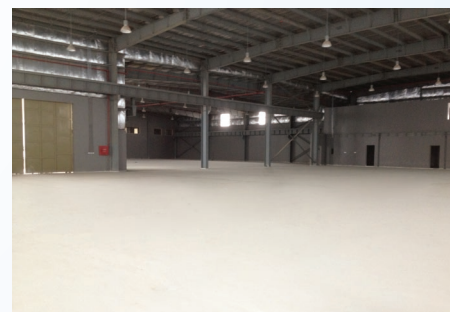
Εργοστάσιο Αλουμινίου, Σαουδική Αραβία